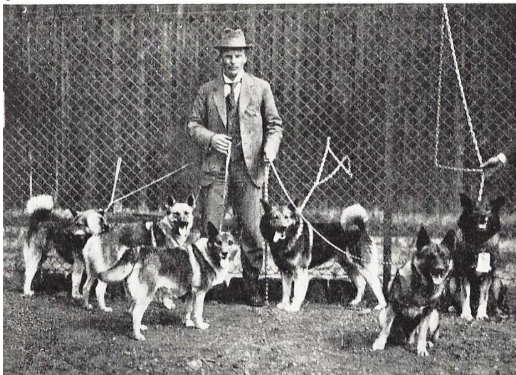
Illustrasjonsfoto: T. Hemsén viser Sanny 2 og hennes avkom

Senere års tillyste prøver måtte innstilles på grunn av manglende tilslutning. Dette er således ett sørgelig kapittel og det skulle nå gå over 30 år før «forsøksprøvene» i Vang startet opp i 1948 og varet i 5 år.