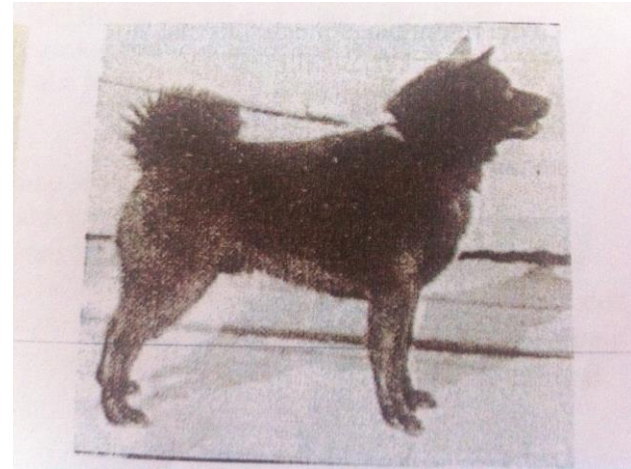
Hunder født på begynnelsen av 1900-tallet